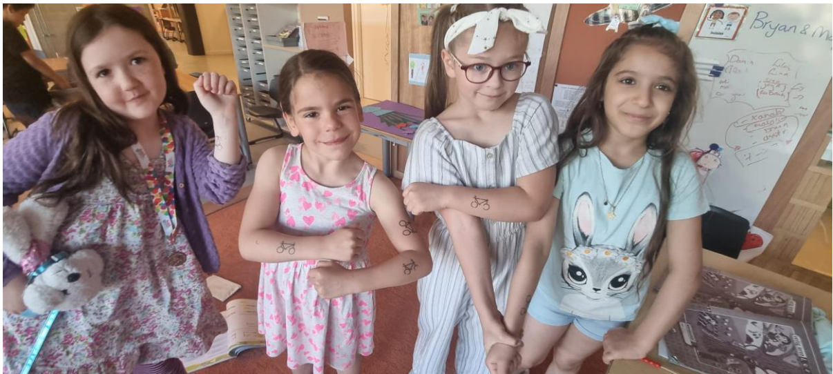
Bovenstaande leerlingen uit groep 3/4 kregen omdat ze op de fiets waren een speciale fietstatoeage.

Bij het naar school brengen van de kinderen werd dinsdag ook gepromoot om voortaan niet met de auto maar met de fiets naar school te komen. Gezond natuurlijk en ook stukken beter voor het milieu.