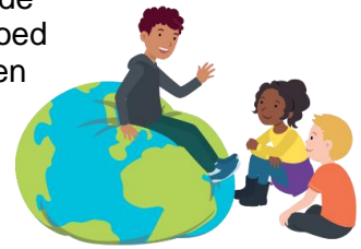
We hebben oor voor elkaar

We bespreken met de kinderen dat mensen op verschillende manieren naar dezelfde dingen kunnen kijken. We spreken dan over het hebben van verschillende 'gezichtspunten'. We kijken soms anders tegen dezelfde dingen aan, omdat we verschillende ervaringen en gevoelens hebben en omdat we uit verschillende gezinnen komen. Op deze manier leren we de kinderen met meningsverschillen om te gaan.