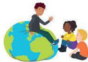
We hebben oor voor elkaar

We gaan voortaan bij de start van elk nieuw blok van Vreedzaam een speciale Vreedzaam oudernieuwsbrief naar u sturen met nog meer informatie en tips om ook thuis samen te praten over dit blok. Via de eigen groepsleerkrachten ontvangen de ouders van de groepen 1 t/m 6 voortaan ook per blok een speciale (digitale) kletskaart .